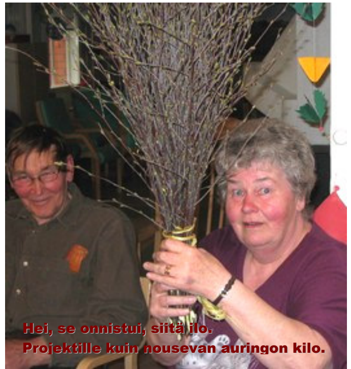
Hei, se onnistui, siitä ilo. Projektille kuin housevan auringon kilo.