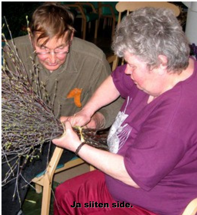
Ja siiten side.