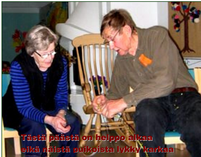
Tästä päästä on helppo alkaa eikä näistä puikoista lykky karkaa