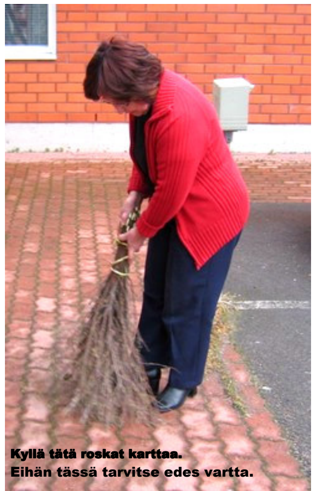
Kyllä tätä roskat karttaa. Eihän tässä tarvitse edes vartta.

Nyt ei kannata roskista itkeä ja huutaa. Parempi on käyttää perinteistä varpuluutaa. Sen voi itse ditsoista vääntää, ei tarvitse nurin kukkaroaan kääntää.